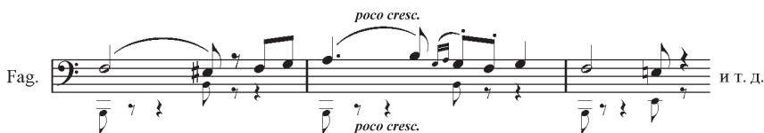
Ил. 4. Н. А. Римский-Корсаков. «Антар». III часть. Вставка В. И. Сафонова

Далее у фаготов (ц. 42, т. 6–8) дописан пропущенный фрагмент партии 2-го инструмента с динамическими указаниями: