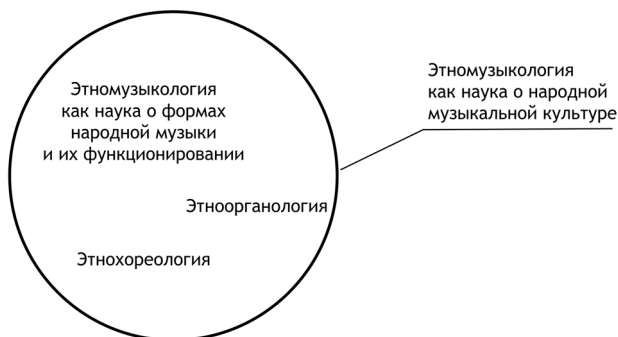
Ил. 1. Этномузыкология как наука о народной музыкальной культуре и музыкально-этнографические дисциплины

текста, культуры и человека в одновременности (синтетическая парадигма — по Земцовскому) [Земцовский 1992, 3]. Данная парадигма является основанием современной этномузыкологии как науки о музыкальной культуре . Ее методология раскрывается в частнодисциплинарных методах этномузыкологии как науки о формах народной музыки и их функционировании , этноорганологии и этнохореологии (ил. 1):