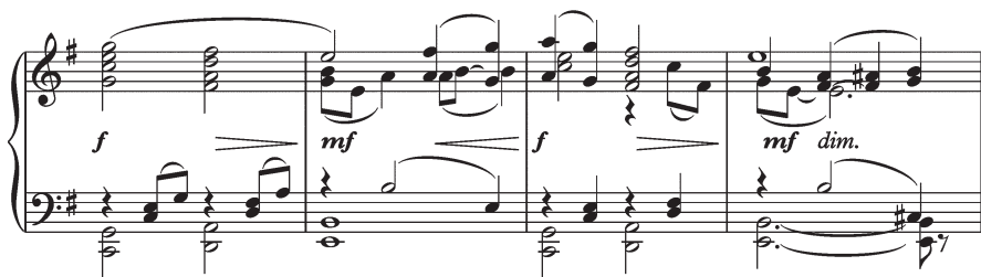
Ил. 5. С. В. Рахманинов. Вторая симфония. Часть I, тт. 98–101

«Природные мотивы» первой части содержат эстетико-философский смысл: любование природой есть освобождение от трагического. Восторженное созерцание простора выразилось в главной и побочной партиях; гармонический рахманиновский ход C–D–e дополняет музыкальное воплощение идеи России (ил. 5):