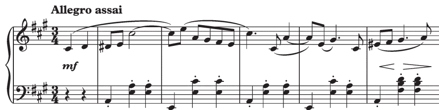
Ил. 14. С. В. Рахманинов. Вальс оп. 10 № 2, тт. 1–4

Вальс — обобщение русского мира, воспоминание о дореволюционной России. Необходимо прочертить непрерывную линию эволюции трагического, прежде всего, сближающую Рахманинова и Чайковского: показательны существенные изменения в трактовках вальса. В отличие от Чайковского вальс у Рахманинова появляется только эпизодически и не занимает доминирующих позиций как одна из опор в художественном мироощущении. Однако даже небольшой частный пример содержит интересные пересечения: шопеновско-скрябинский дух раннего Вальса оп. 10 № 2 (ил. 14, 15) наполняется меланхолией в стиле Чайковского (ил. 16):