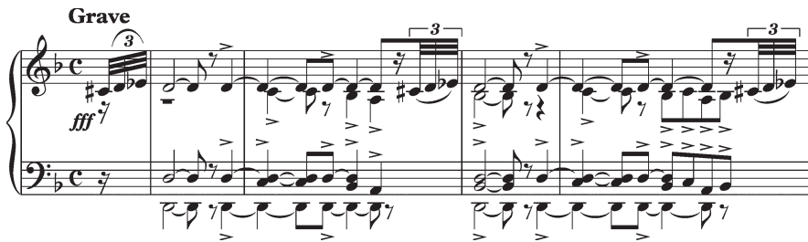
Ил. 1. С. В. Рахманинов. Первая симфония. Часть I, тт. 1–4

Сквозь тему вступления, близкую к древнерусской церковно-литургической традиции, «просвечивают» мерцающие аллюзии на Dies irae (ил. 1). Несмотря на секундовое интервальное строение, тема вступления настраивает на восприятие Dies irae 10 ; далее — тематизм главной партии с терцовыми интонациями почти точно воспроизводит музыкальный символ гнева Всевышнего (ил. 2). «Проблески» Dies irae сопоставимы с его появлением в Фортепианном квинтете Н. К. Метнера (ил. 3):