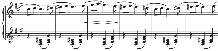
Илл. 16. С. В. Рахманинов. Вальс op. 10 № 2, тт. 41–46