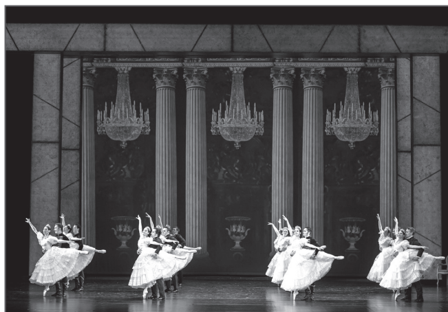
Бал в Петербурге. Казанский театр оперы и балета имени Мусы Джалиля. 27 сентября 2023 года.

тический образ создавал М. Тимаев, восточное спокойствие и умудренность при легкости исполнения танцевальных па отличали Иакинфа И. Гайфуллина.