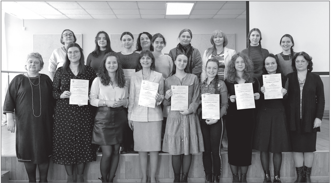
Вручение сертификатов участникам конференции. 8 апреля 2023 года

ной России. Не осталась без внимания деятельность отечественных ученых по обработке знаменной монодии и грузинских ученых XIX–XXI вв. по изучению средневековой певческой традиции.