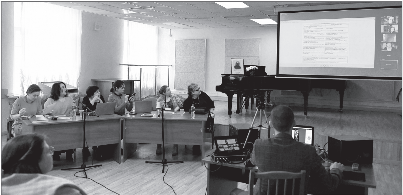
Участники научно-исследовательского семинара. 6 апреля 2023 года

Е. П. Почему такой оригинальный и серьезный семинар был включен именно в программу конференции молодых специалистов?