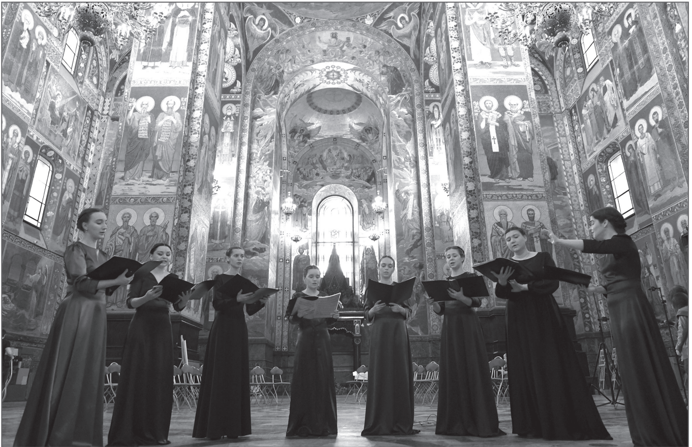
Концерт в храме Спаса-на-Крови. 7 апреля 2023 года