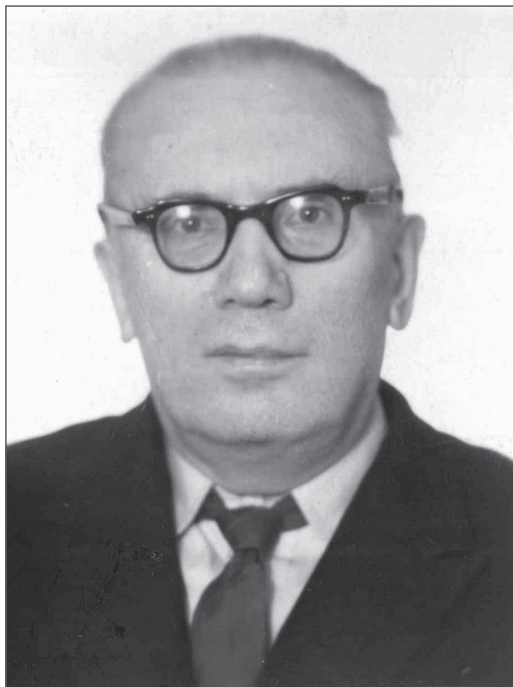
М. В. Бражников. 1971 год

ными людьми — носителями истины. Это был глоток свежего воздуха, я словно находилась на вершине горы. В ту пору один мой новосибирский знакомый, уникальный ученый Абрам Ильич Фет, привел меня к выдающемуся историку Николаю Николаевичу Покровскому. Древнерусская музыка появилась в моей жизни именно благодаря Покровскому. В мире исторической науки он слыл личностью легендарной, в свое время работал в Суздале и был консультантом на съемках фильма Андрея Тарковского «Страсти по Андрею» (так первоначально называлась картина «Андрей Рублёв»).