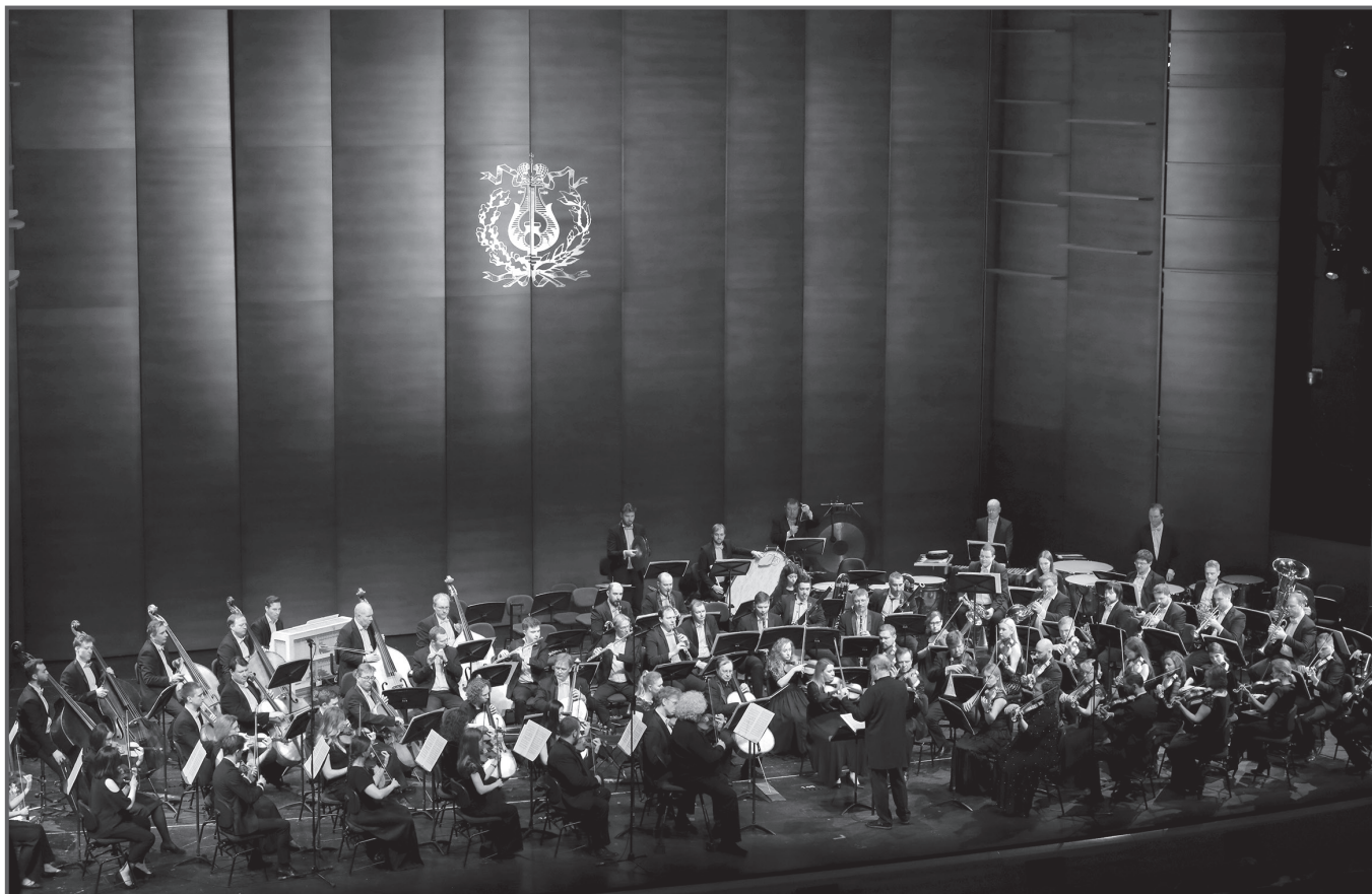
Стравинский-гала (дирижер В. Гергиев). Мариинский-2. 17 июня 2023 г.

сколько неуклонного накопления и — удержания накала эмоций. К сожалению, звездный состав не стал гарантией качества. Возможно, свою роль сыграла своего рода инерция двигательного воплощения, возникшая на протяжении многодневного марафона музыки Стравинского. Пожалуй, сказывалась и недостаточная отделка, не достигшая баланса разных исполнительских групп и необходимой филигранной отточенности деталей. Общий эмоциональный напор контрастировал с вялыми вступлениями хора. Форма «поплыла», — впечатление от концерта оказалось смазанным.