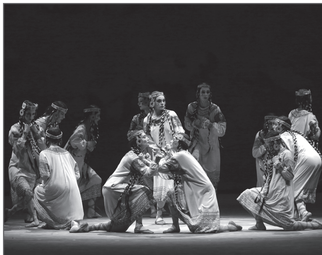
Постановка балета «Весна священная». Мариинский-2. 22 июня 2023 г.