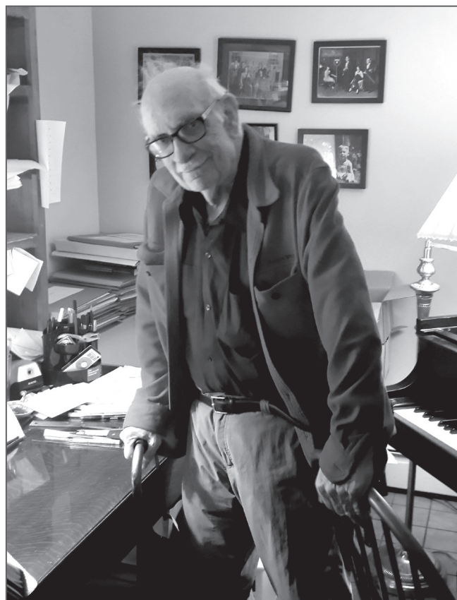
Джордж Крам у себя в кабинете. 2017 год