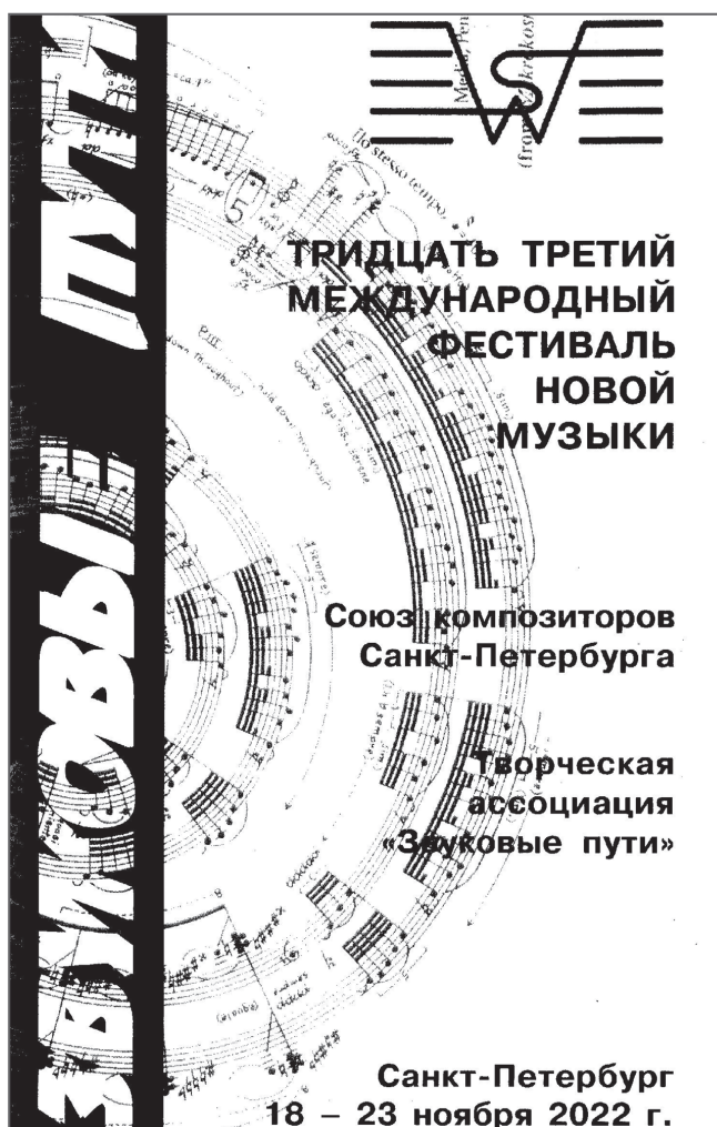
Обложка буклета XXXIII международного фестиваля новой музыки «Звуковые пути». 2022 год

Финальный хоровой концерт «Сергей Слонимский и его школа» состоялся 23 ноября в Малом зале филармонии. В 2022 году Сергею Михайловичу исполнилось бы 90 лет. «Звуковые пути» он поддерживал со времен основания, его музыка органически вписывалась в контекст наших программ, а ряд сочинений композитор написал специально для премьерного исполнения на фестивале. В 1998-м он стал Почетным членом Творческой ассоциации «Звуковые пути». Большой Мастер, он был не только выдающимся композитором, но и Учи-