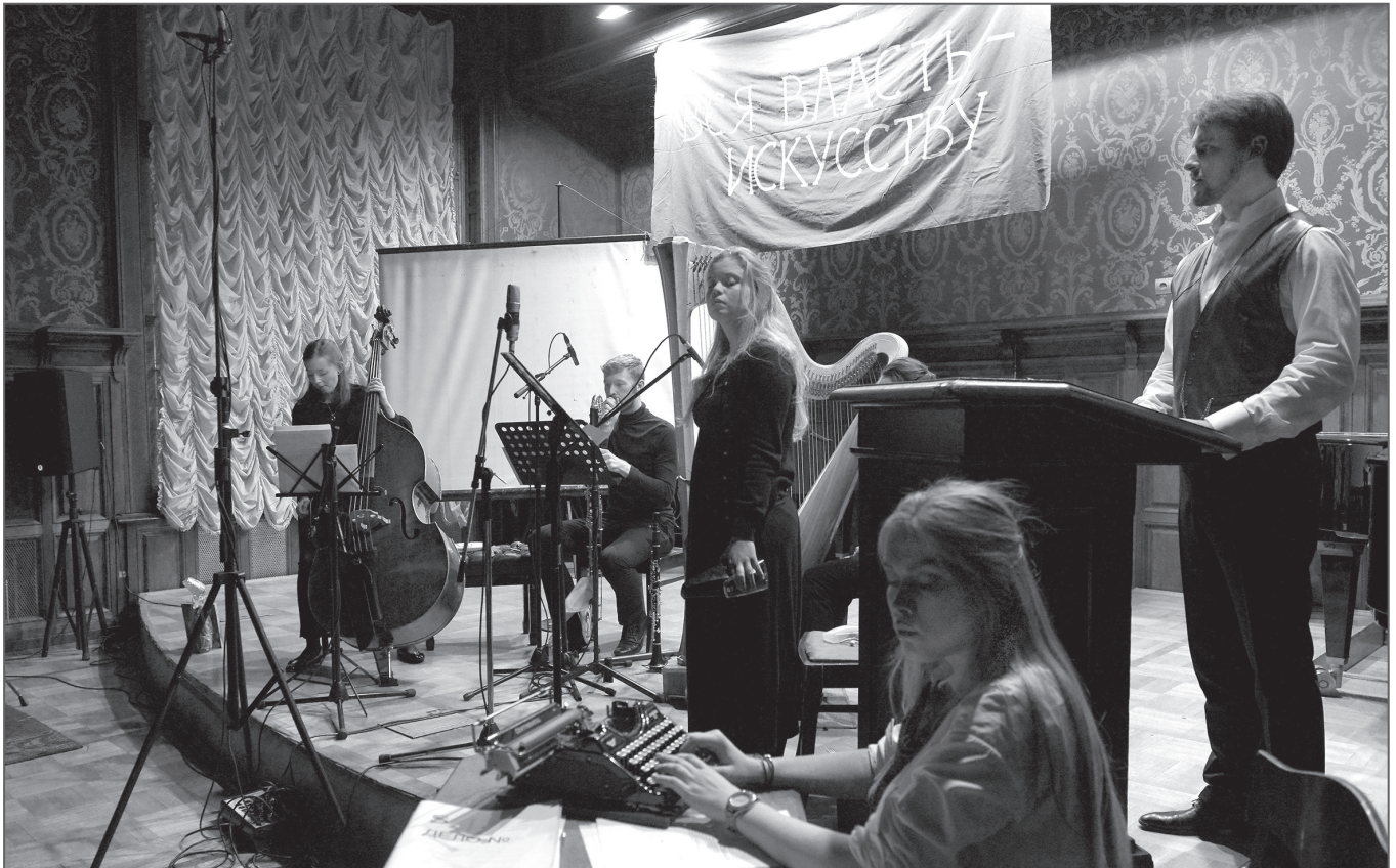
Концерт-митинг: ансамбль Hermes (Великобритания). Дом композиторов Санкт-Петербурга. 2017 год