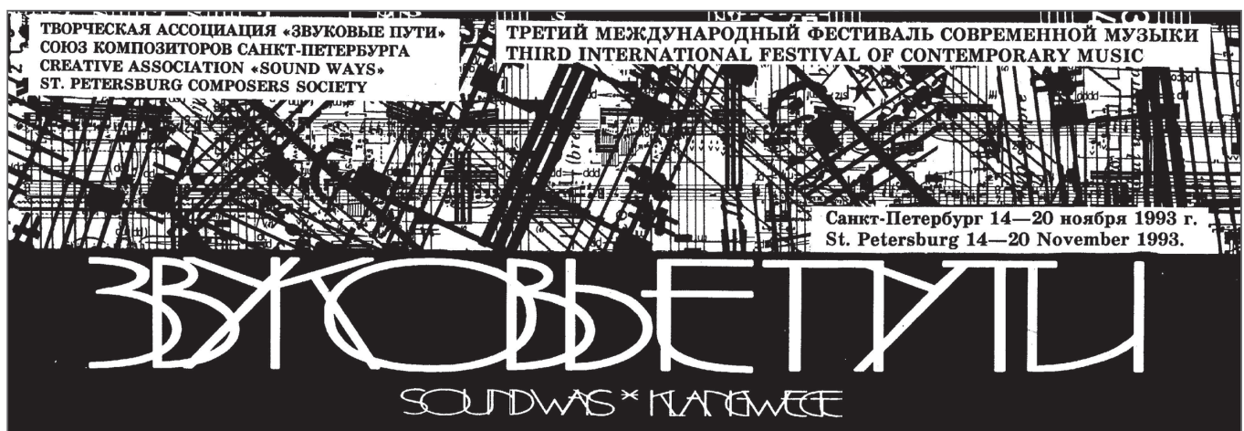
Обложка буклета III международного фестиваля современной музыки «Звуковые пути». 1993 год