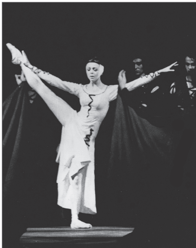
Дочь Сановника (Г. Шляпина). 1978 год.

А. П. Король должен был быть артистом с харизмой, высокого роста и, главное, не тяжелый, так как его должны были поднимать и все время носить на руках. В труппе я нашел вполне подходящего для этой роли стройного и высокого танцовщика с красивым и выразительным лицом. В сцене с его участием, где Призрак подтверждал, что в его смерти виновен брат, мужской кордебалет делал с ним довольно сложные поддержки. Он шел по плечам танцовщиков, словно по воздуху, а женский кордебалет с плащами закрывал от зрителя техническую «кухню». Мне хотелось достичь эффекта, при котором Призрак как бы парил в воздухе.