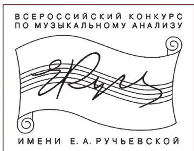
Логотип и страница (QR-код) Всероссийского конкурса имени Е. А. Ручьевской по музыкальному анализу на сайте СПбГК