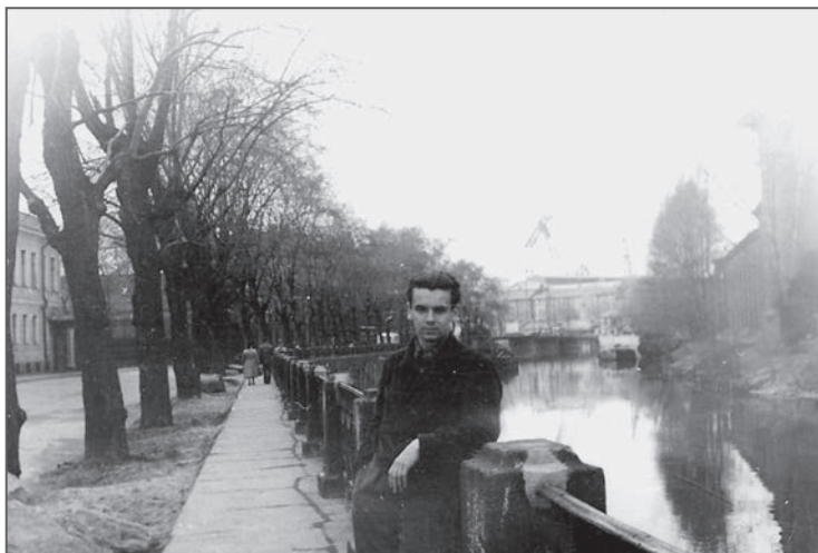
На набережной Мойки. 1958 год