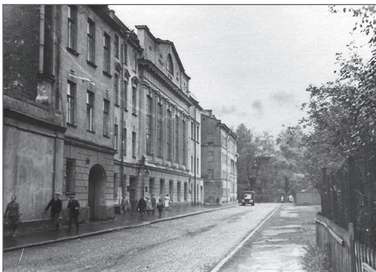
Здание школы-десятилетки (пер. Матвеева 2). 1958 год

означать, что он прошел проверку и «его вопрос» будет решен положительно .