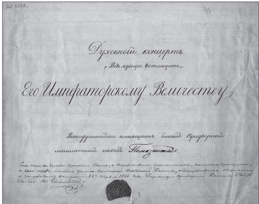
Духовный концерт И. А. Помазанского. Титульный лист с подписью-автографом композитора и припиской Н. И. Бахметева. 1866 год. ОР РНБ. Ф. XII. № 43

[14, с. 2]; в заметке также сказано о похвальном листе, полученном пианистом Помазанским.