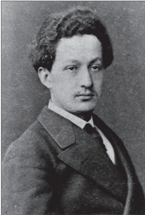
И. А. Помазанский. 1870-е годы