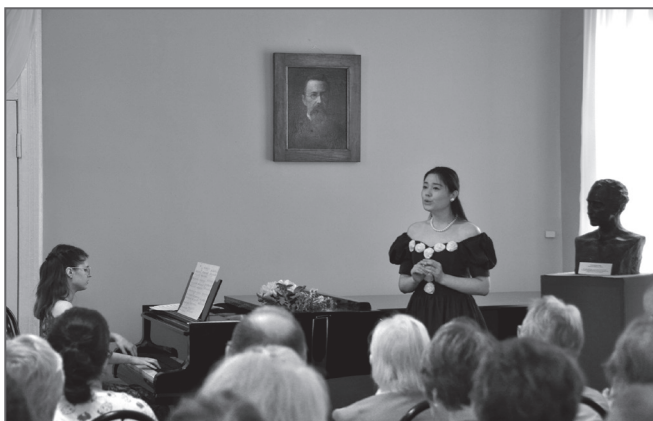
Афиша концерта студентов Санкт-Петербургской консерватории в Вечаше Исполнители и гости Мемориального музея-усадьбы Н. А. Римского-Корсакова

шиеся на Троицу (лирическая «На калинке соловей» и плясовая «Под зарёю сидела»). Искренний восторг и неподдельное восхищение концертом зрители высказывали не стесняясь, что создавало очень теплую атмосферу в зале. Расходиться не хотелось... И музыкальное действо, по сложившейся традиции, было продолжено на улице: Фольклорный ансамбль завел хороводы, участие в которых с удовольствием приняли многие гости Вечаша.