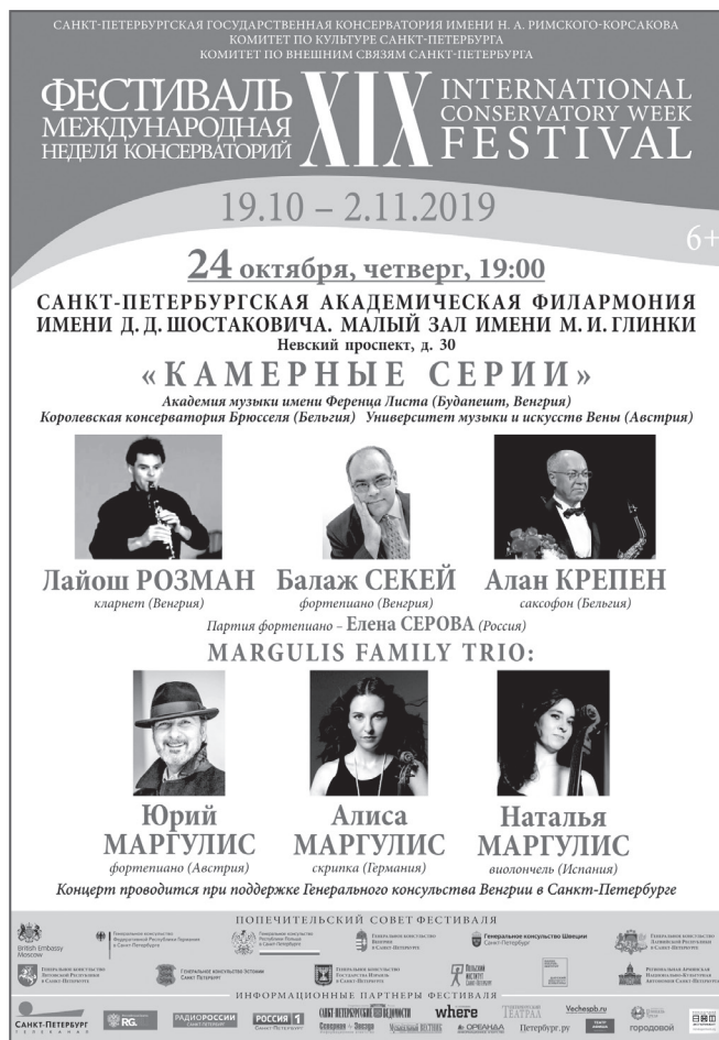
Афиша концерта «Камерные серии» с участием Margulis Family Trio. 2019 год