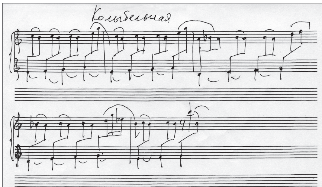
Рогалев И. Колыбельная из фортепианной сюиты «31 декабря». Фрагмент автографа

— Чего ты, я еще обедаю, — сказал папа, дожевывая котлету.