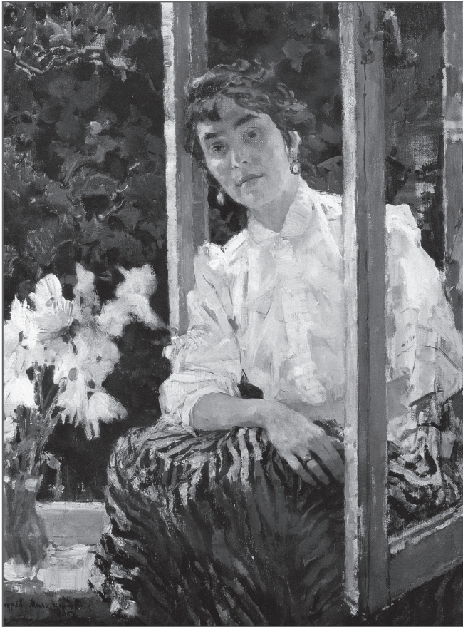
Мыльников А. А. Портрет жены. Холст, масло. 1956 год. Третьяковская галерея (Москва)