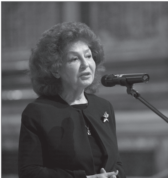
На концерте «Хоровые академии». Исаакиевский собор. 25 октября 2020 года

в развитии культурных контактов Северной столицы с другими странами.